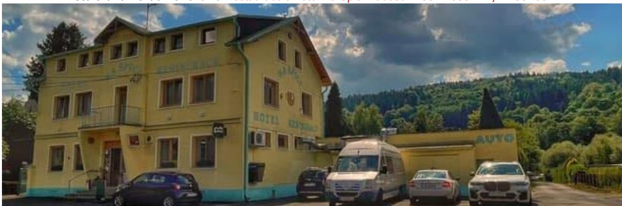
Místo v honitbě GPS v honitbě „BUFET“ u Javorenského rybníka: 50.1804311N, 13.0734756E