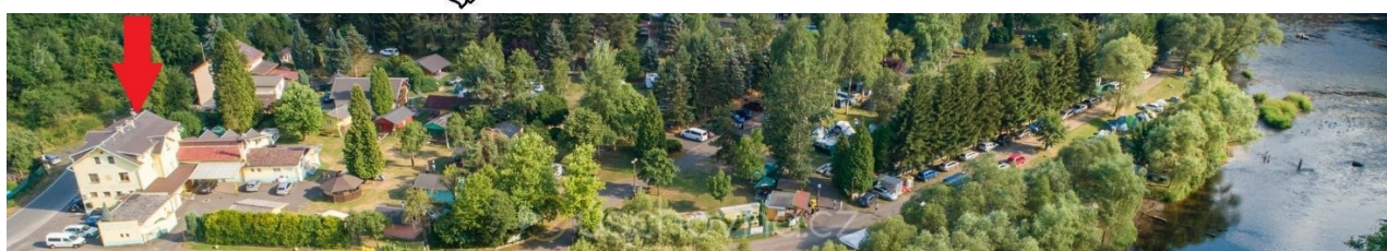
Místo srazu 25.08.2023 GPS Restaurace a hotel Na Špici Radošov: 50.2703914N, 12.9946042E